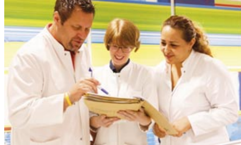
Medizin im Dialog