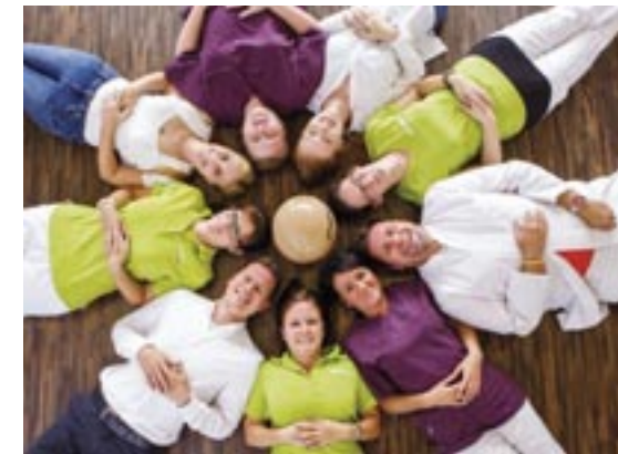
Ein starkes Team

Aber auch die vielen Servicekräfte sowie alle Ansprechpartner in Sozial- oder Verwaltungsfragen tragen jeden Tag dazu bei, dass unser Haus nicht nur zu den modernsten, sondern vor allen Dingen auch zu den freundlichsten Rehakliniken in Deutschland zählt. Die räumliche Vernetzung mit dem Akutkrankenhaus Bergmannsheil Buer optimiert unsere diagnostischen und therapeutischen Möglichkeiten. Denn wie gesagt: Zusammen sind wir ein starkes Team!